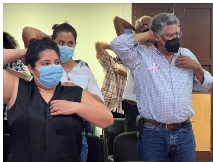
Pláticas de cáncer de mama en las instalaciones de INDEMAYA.