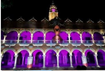
Iluminación del palacio municipal de Mérida.