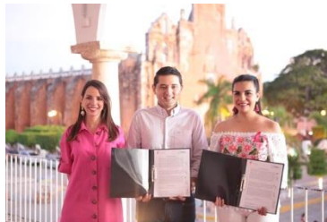
Firma de convenio e iluminación del Palacio Municipal de Tekax.