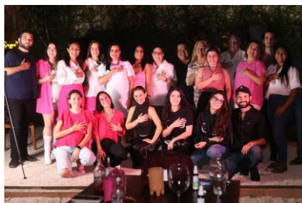
Plática de sensibilización de cáncer de mama en la empresa "Casa Consciente"