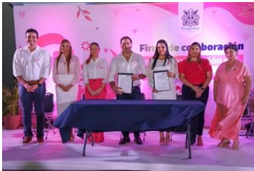
Firma de convenio e iluminación del Palacio Municipal de Progreso.