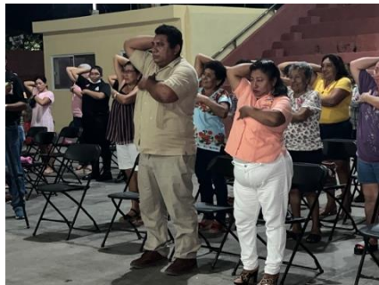
Pláticas de sensibilización de cáncer de mama en Yaxkkul.