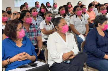
Pláticas de sensibilización de cáncer de mama en Progreso.