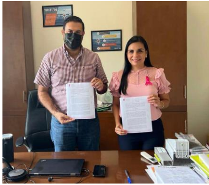
Firma de convenio con la empresa AEI.