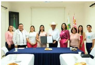
Firma de convenio e iluminación del Palacio Municipal de Tizimín.